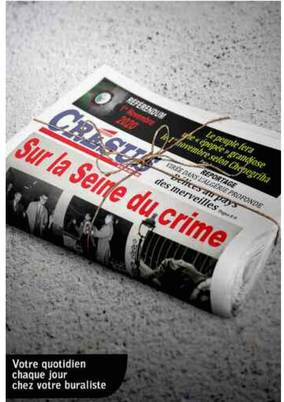
CRÉBUS # 583 DU LUNDI 8 MARS 2021- ANEP 2116004288

Votre quotidien chaque jour chez votre buraliste