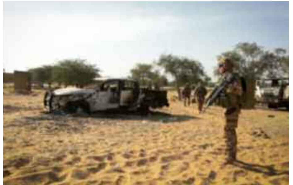
lences djihadistes qui ont fait depuis 2015 plus de 1 400 morts et plus d'un million de personnes déplacées, fuyant les zones de violences.

Les 17 et 18 mai, quinze villageois et un soldat avaient été tués lors de deux assauts contre un village et une patrouille dans le nord-est du pays, selon le gouverneur de la région burkinabè du Sahel. Depuis le 5 mai, face à la recrudescence des attaques djihadistes, les forces armées ont lancé une opération d'envergure dans les régions du Nord et du Sahel. Malgré l'annonce de nombreuses opérations de ce type, les forces de sécurité peinent à enrayer la spirale de vio-